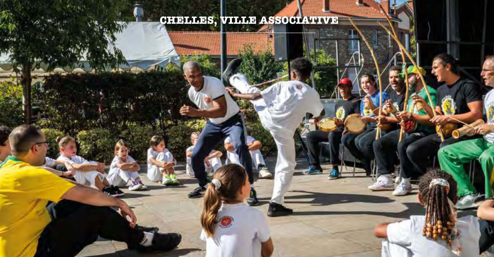
L'association Zumbi capoeira au Carrefour des associations le samedi 6 septembre dernier.