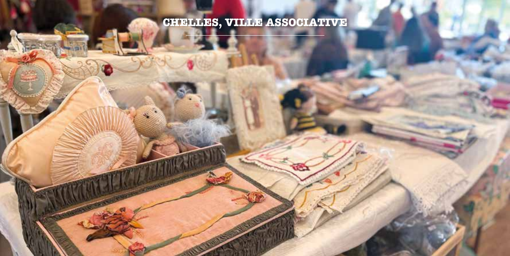
Puces des couturières organisées par Récipro'savoirs le samedi 5 avril dernier au Centre culturel.

L'ASC Tennis, l'ASC Judo et Tribe Organisation – gestionnaire du Cosa skatepark de Chelles – interviennent en outre dans les écoles pour des actions ciblées en concertation avec l'Inspection de l'éducation nationale.