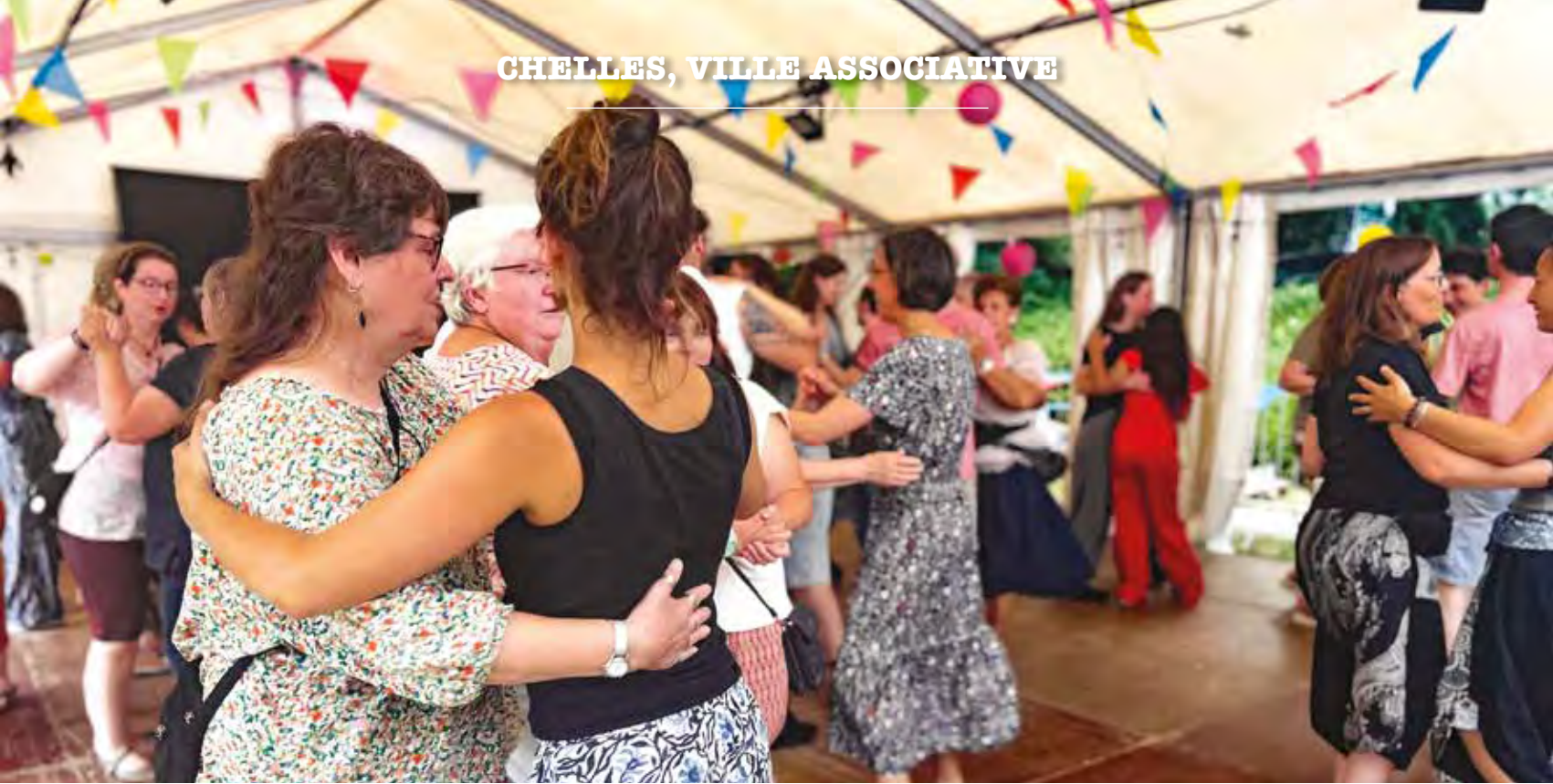
Bal folk organisé le samedi 14 juin par l'association Traditionnellement folk.

nombreux autres domaines afin de répondre aux besoins des habitants : environnement, animation du territoire, défense des droits, logement, aide à