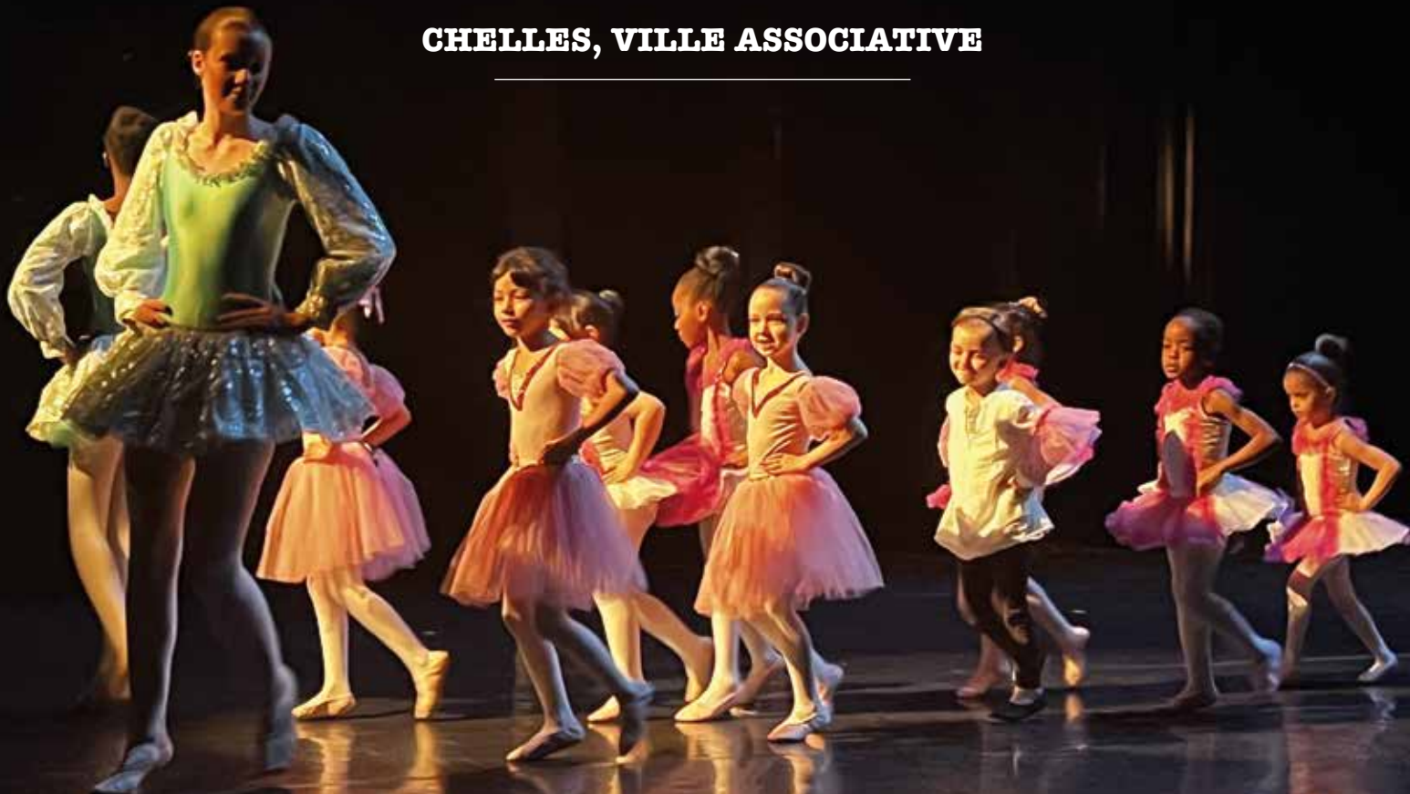
Gala ASC Danse le dimanche 2 juin 2024 au Théâtre de Chelles.