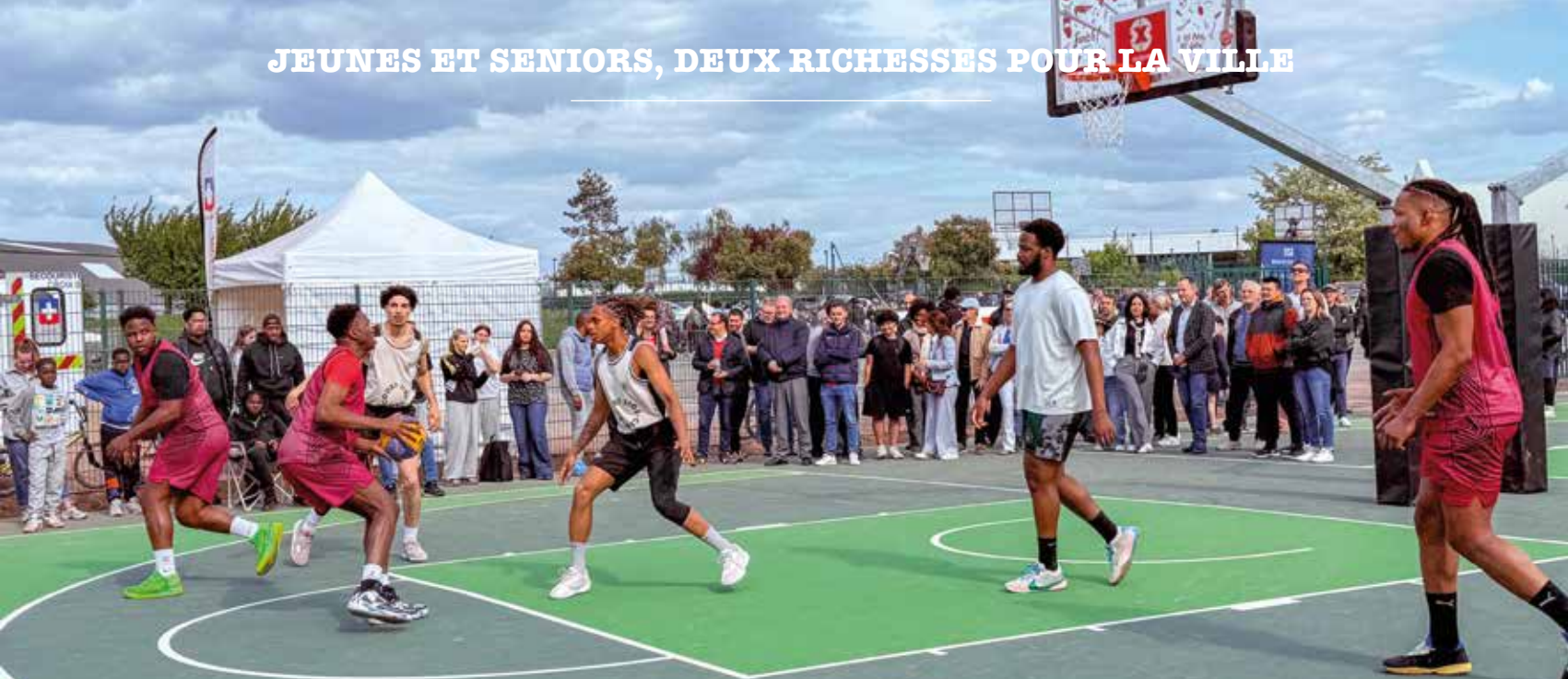
Inauguration des terrains de basket 3x3 Marine Johannès le 8 mai 2025 au complexe sportif Maurice Baquet.