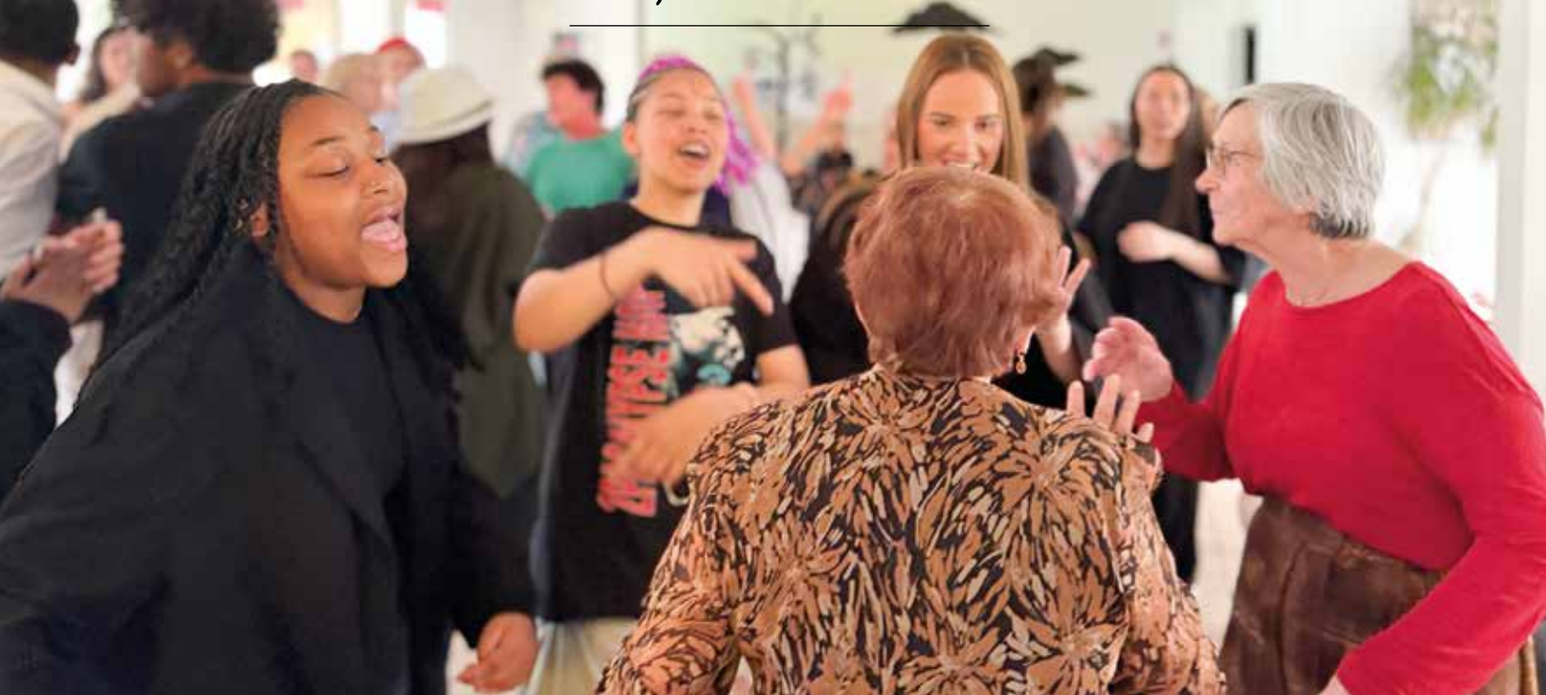
Repas intergénérationnel à la résidence Henri Trinquand avec les élèves du lycée Jehan de Chelles.