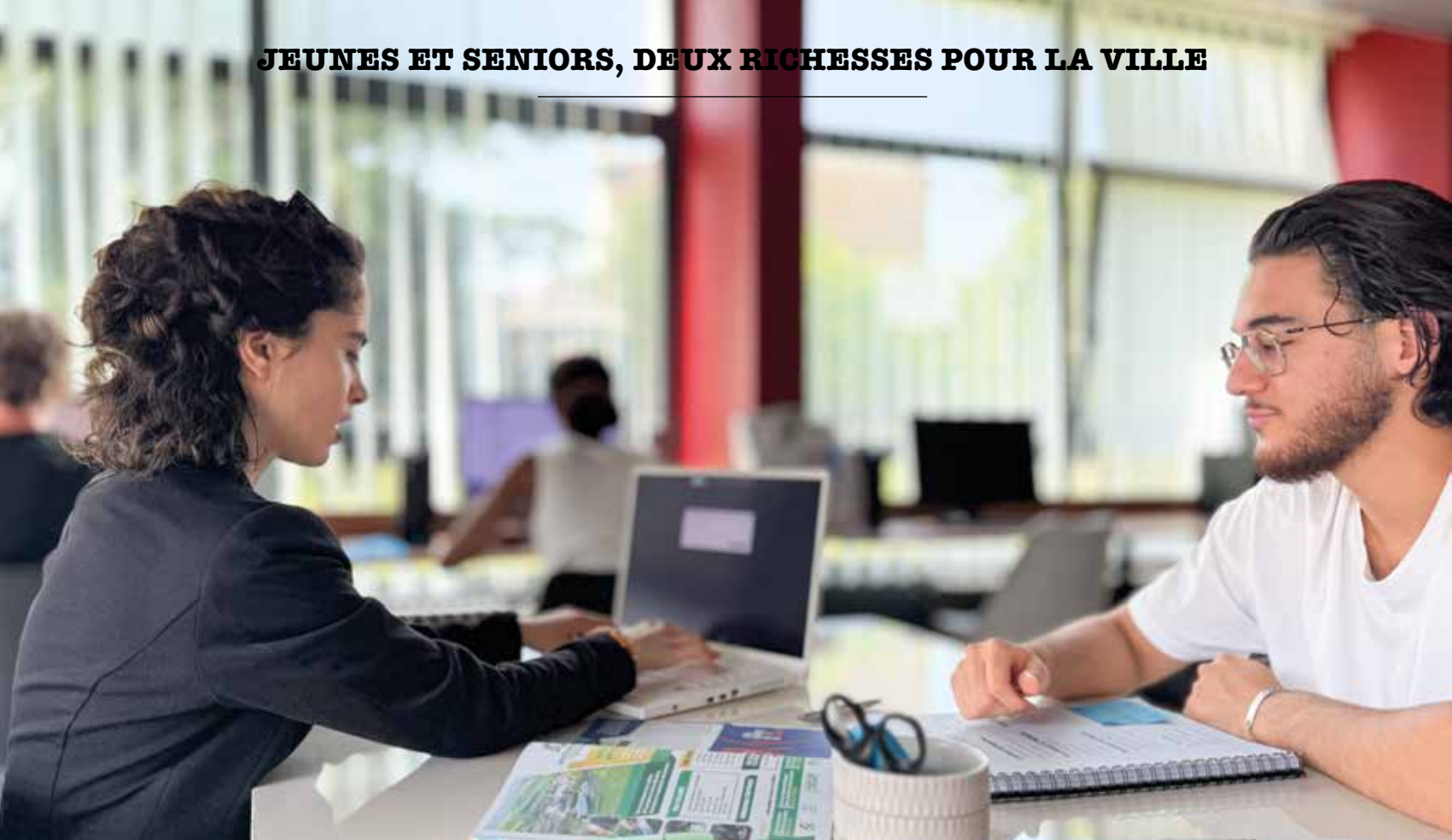
Structure information jeunesse La Boussole.