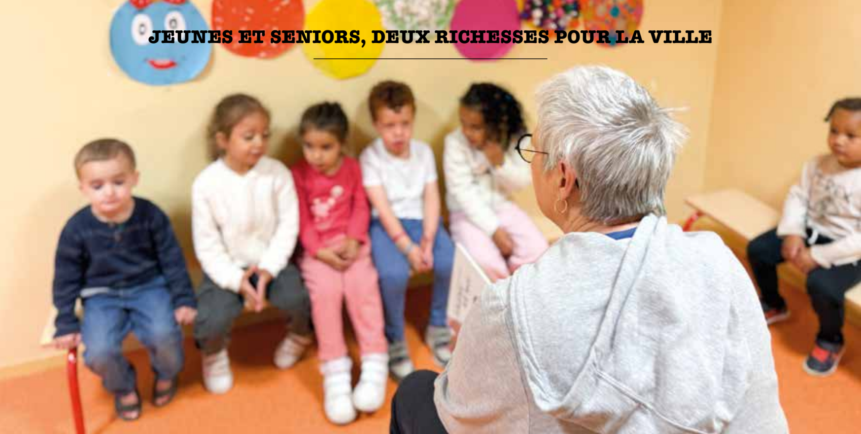
Dispositif "Il était une fois à Chelles" à l'accueil de loisirs Alexandre Bickart.

sport, culture, loisirs ou encore domaine humanitaire par exemple. Annuaire des associations sur www.chelles.fr