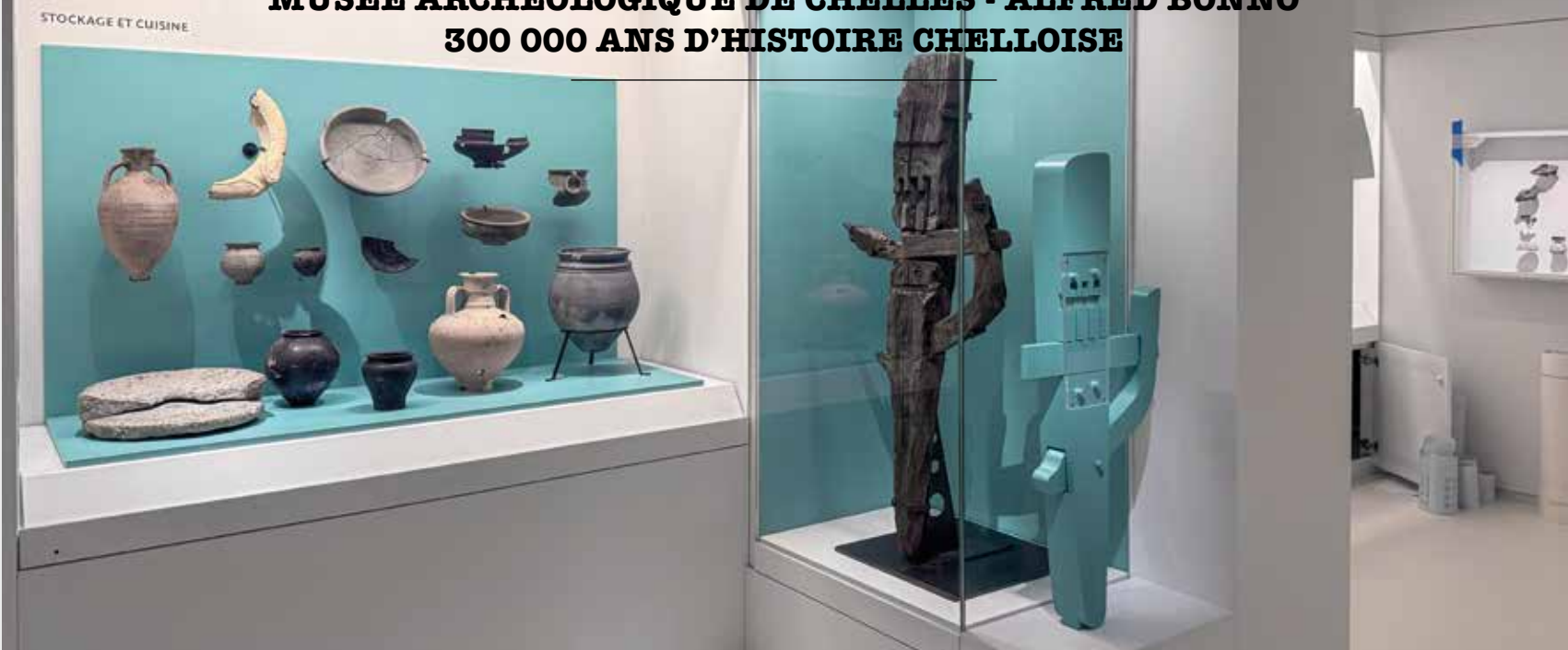
Poteries et vaisselle. À droite : serrure sur pied, 4 e -7 e siècle.

À partir de 18h30, place ensuite à la Nuit des Musées ! Dès 18h30, les visiteurs pourront échanger avec les médiateurs présents sur les collections du musée.