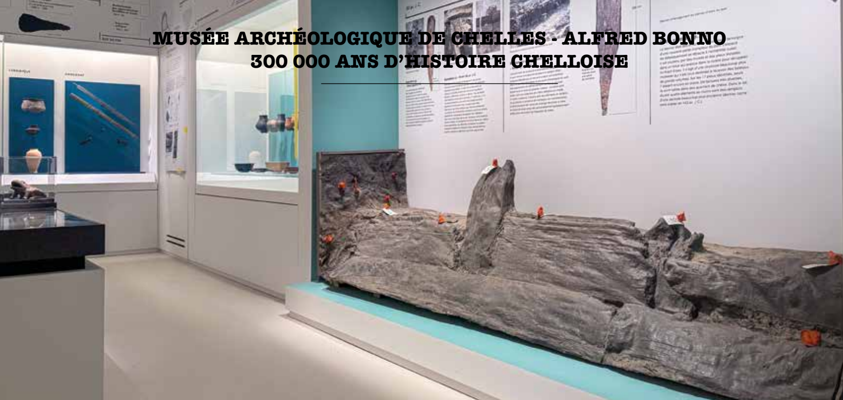
Moulage du quai romain retrouvé rue Gustave Nast 1 er siècle avant J-C.

des expositions temporaires, autour de thématiques qui permettront de faire le lien avec l'histoire chelloise.