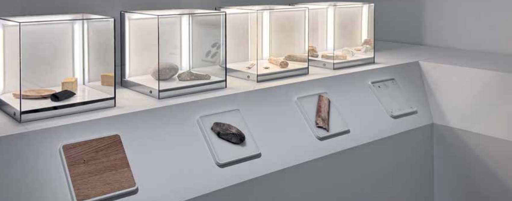
Présentation des différents matériaux.

A vec l'ouverture du nouveau musée archéologique de Chelles - Alfred Bonno, notre ville franchit une nouvelle étape dans la valorisation de son histoire et de son patrimoine, riche de 300 000 ans de vie chelloise autour de la Marne.