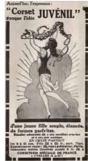
Réclame parue dans Les Annales en 1924 - nouvellesuzette.canalblog.com