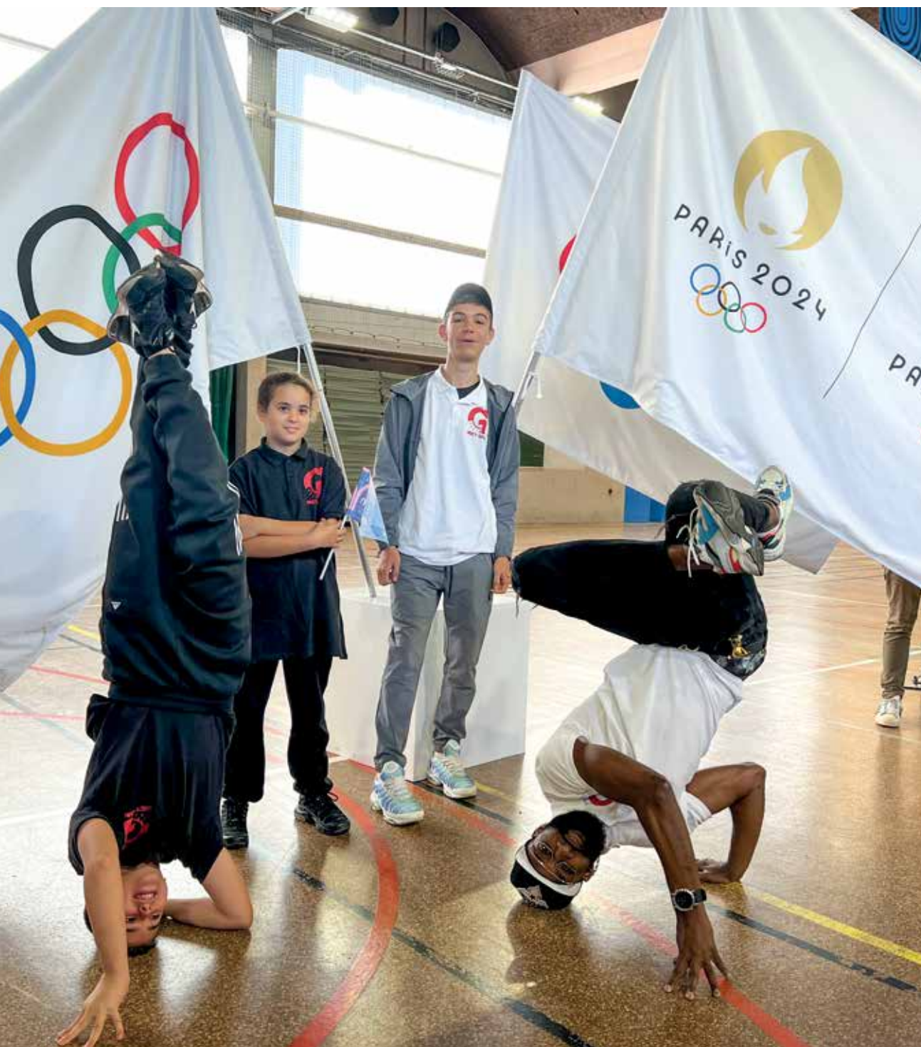
Tournée des drapeaux olympiques et paralympiques.