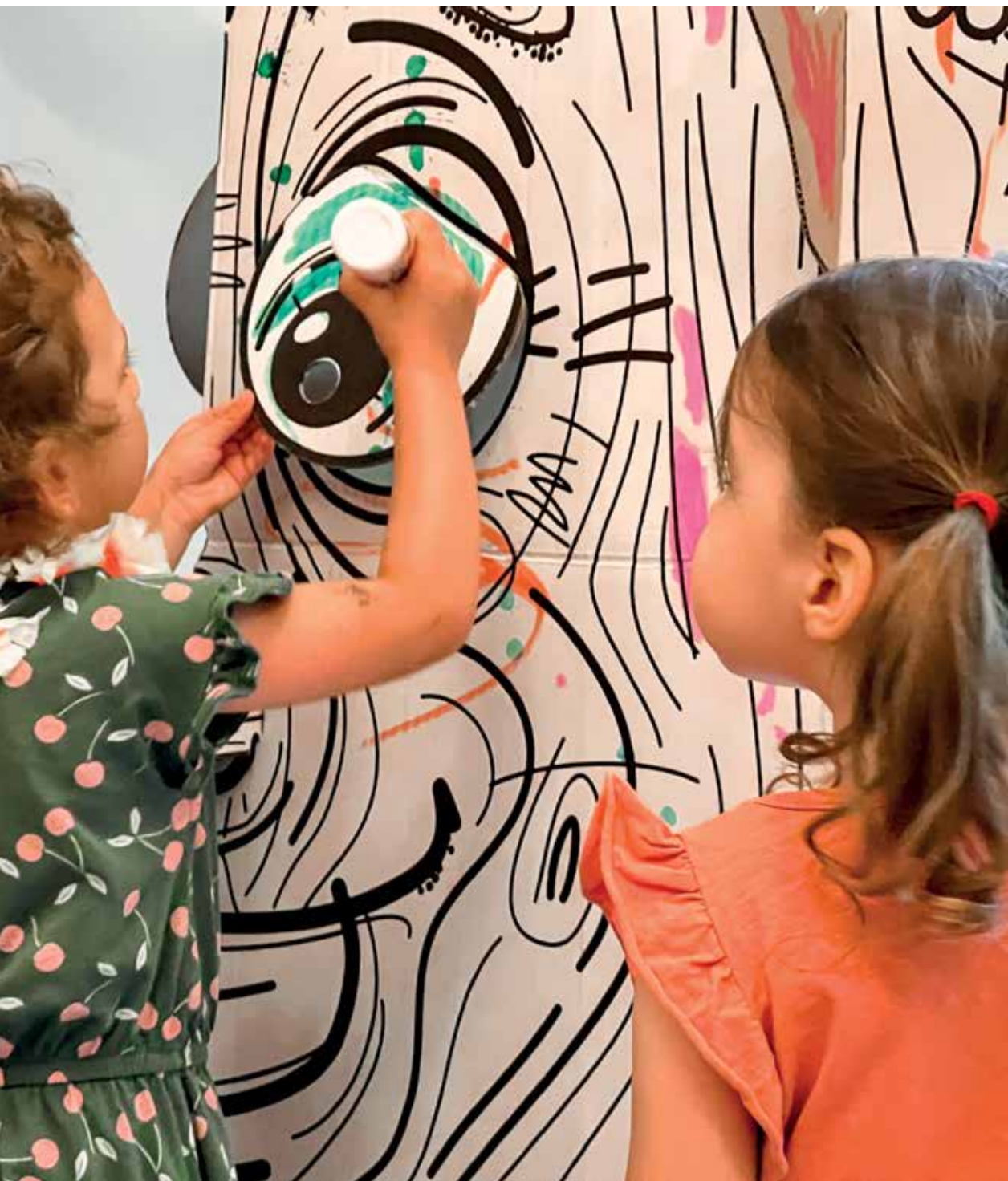
Animation au sein du Relais petite enfance.