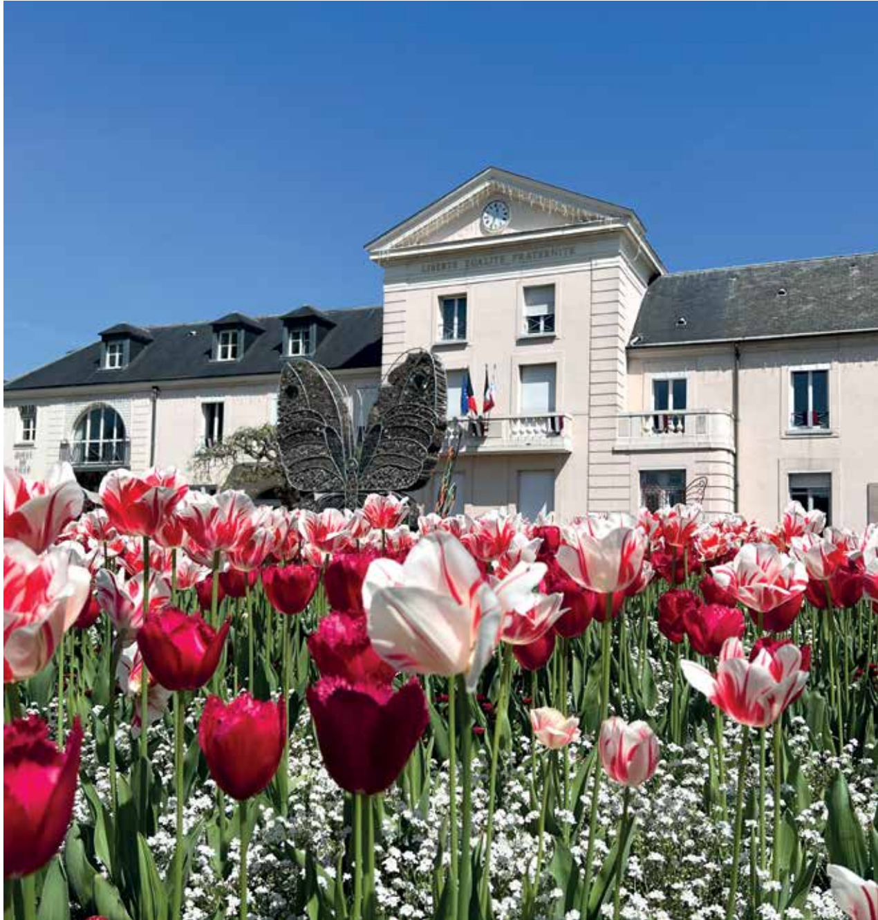
Parvis de l'Hôtel de ville en fleurs.

17 millions d'euros de désendettement en 10 ans