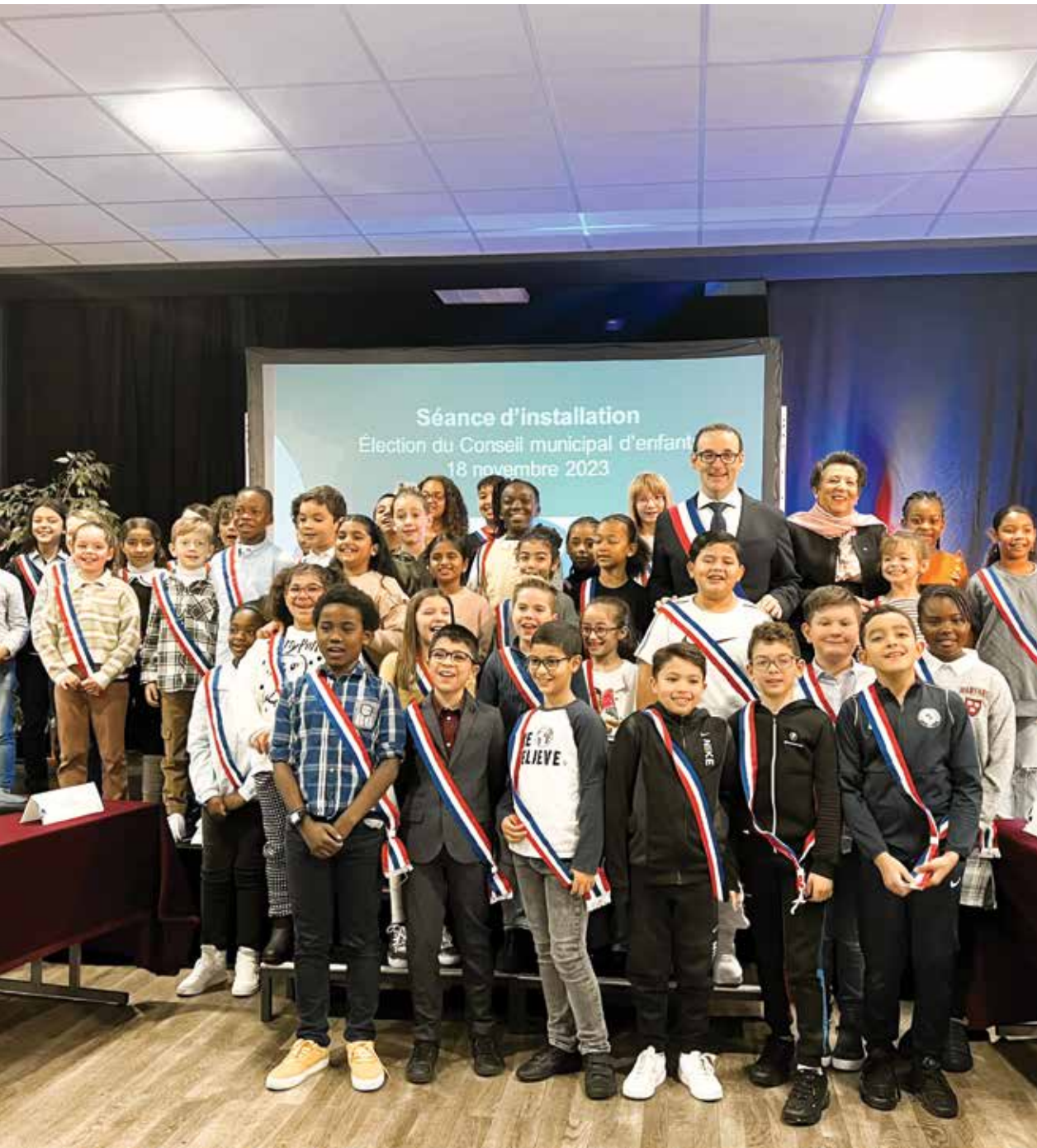
Séance d'installation du Conseil municipal d'enfants 2023/2025.