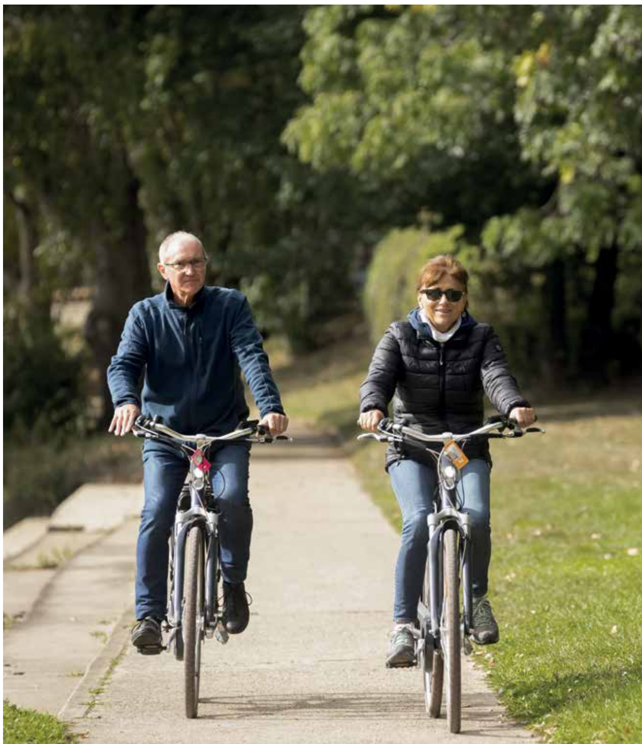
Promenade en vélo sur les bords de Marne.