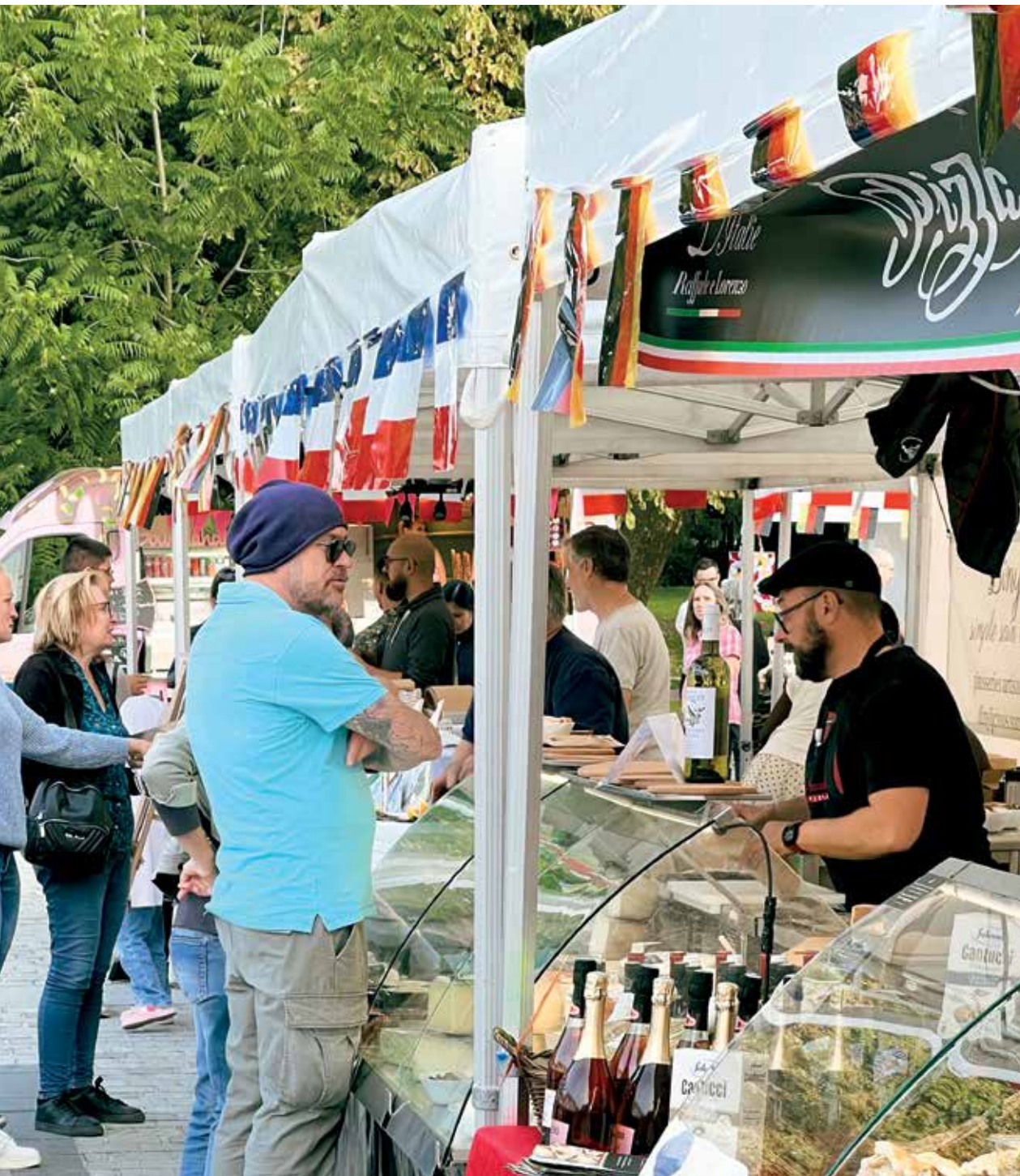
Marché nocturne spécial jumelage.