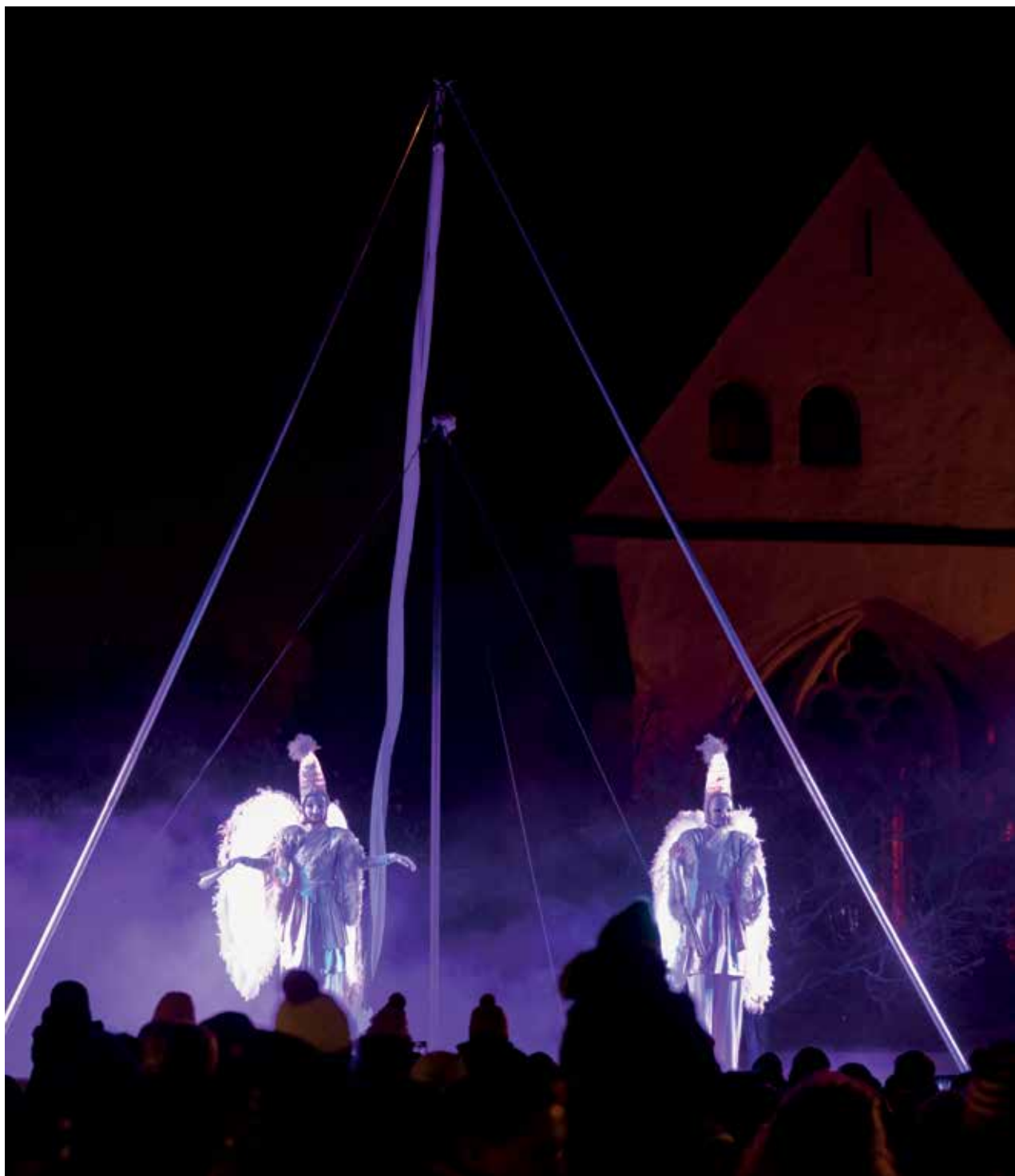
Spectacle Rêves, parvis de l'Hôtel de Ville.