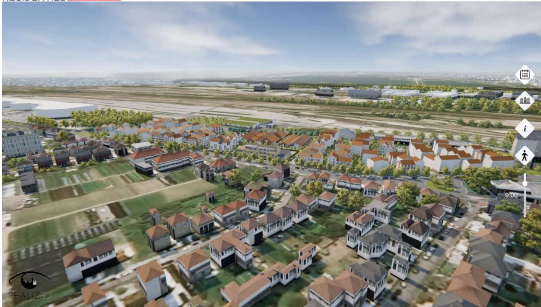
Vue côté Avenue Gendarme Castermant