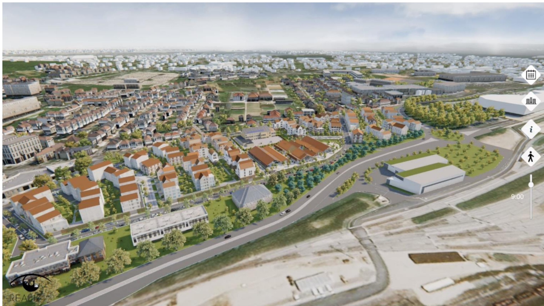
Vue depuis la départementale