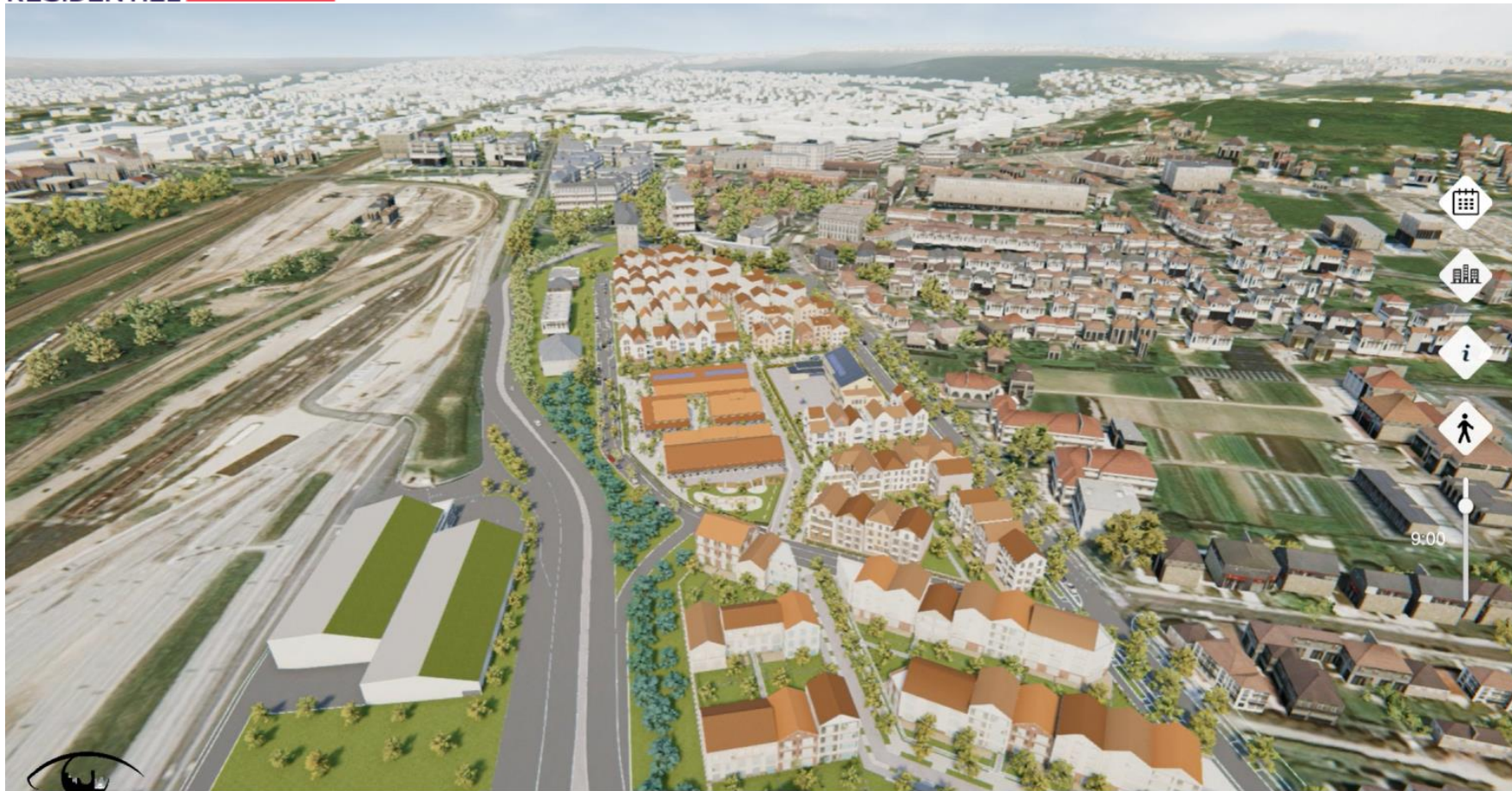
Vue depuis l'est avec la continuité de la ZAC de l'Aulnoy

Vous trouverez également ci-joint une coupe réalisée dans le cadre de l'AVP des espaces publics à rétrocéder.