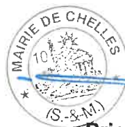
Brice Rabaste Maire de Chelles,