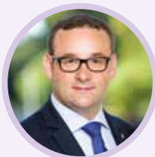
Brice Rabaste, Maire de Chelles